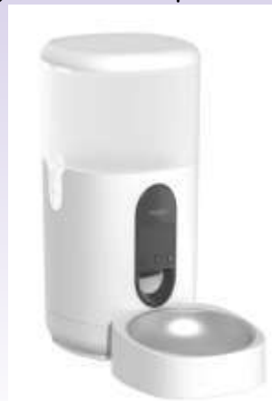
Розумна годівничка для тварин